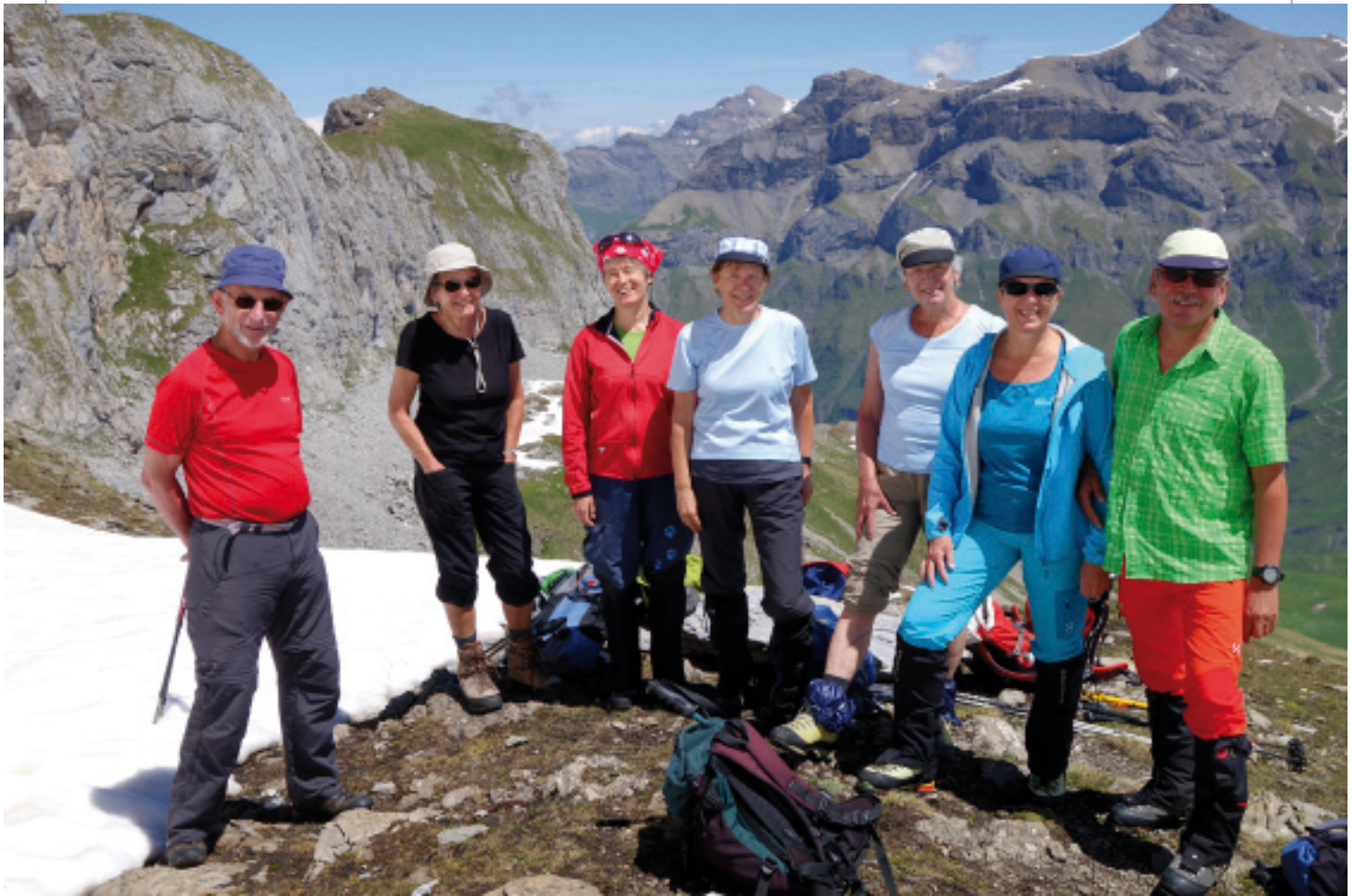
Unterwegs am Bundstock