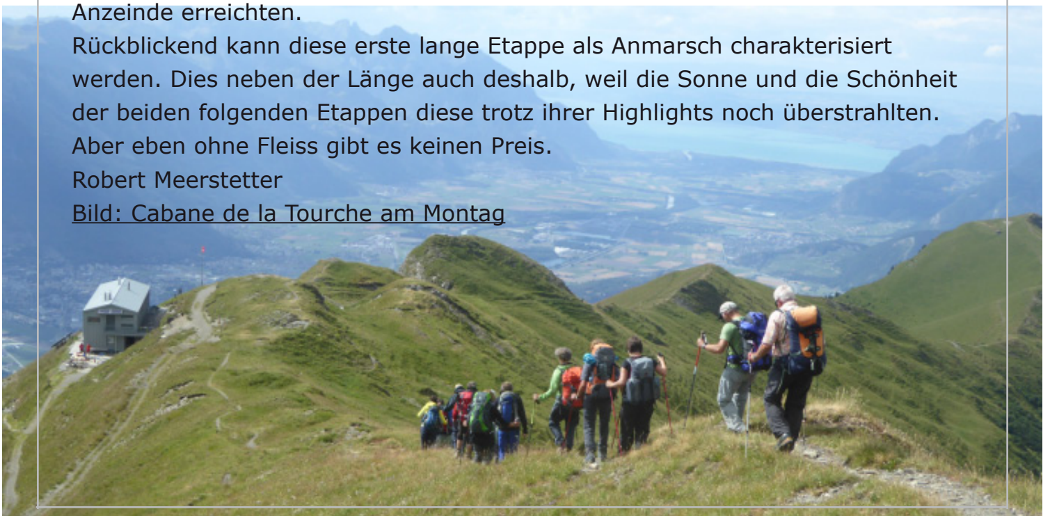
Bild: Cabane de la Tourche am Montag