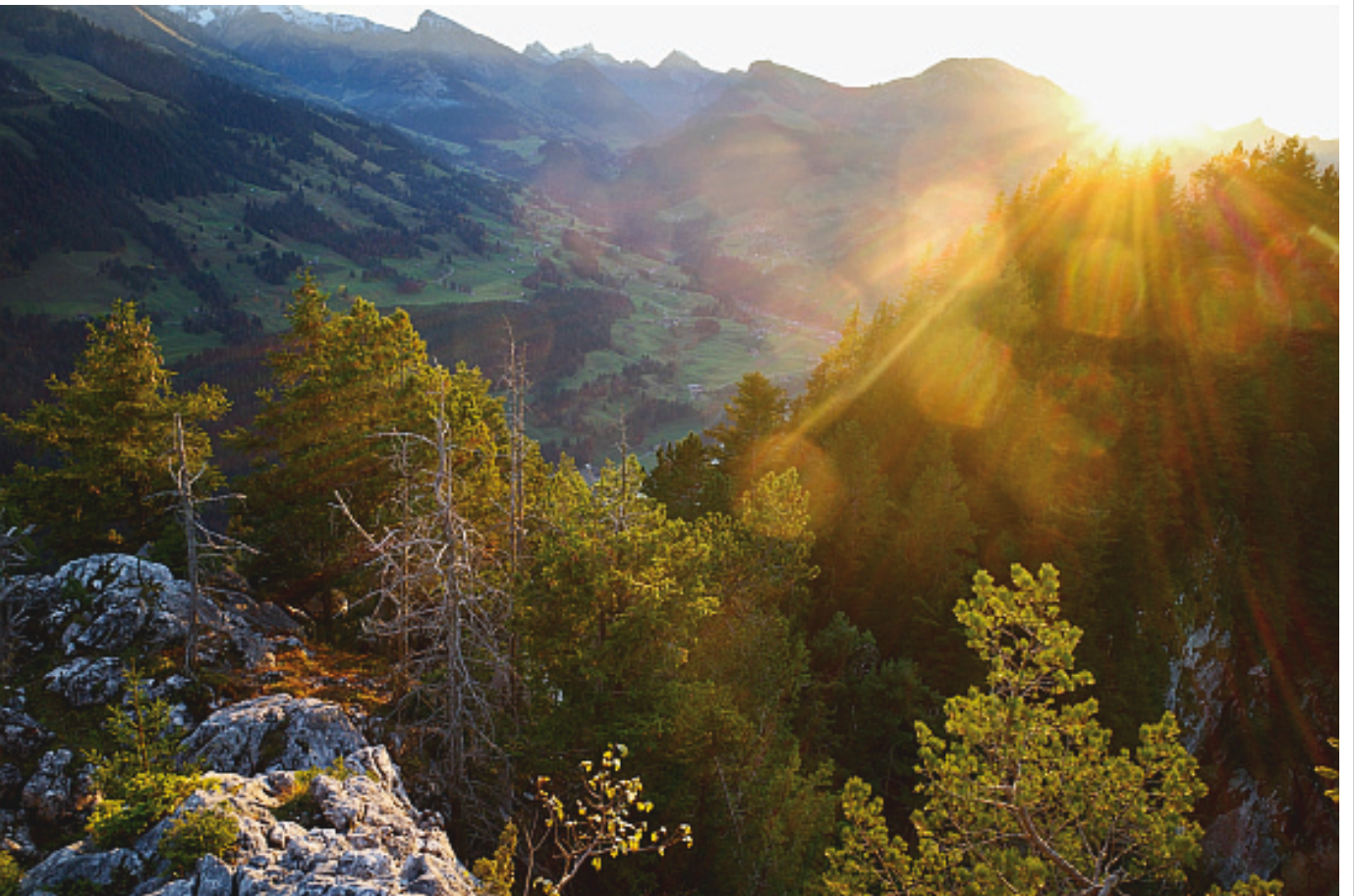
31. Oktober A Mittagflue (Simmenfluh)